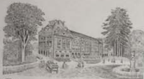
Trianon Palace Versailles