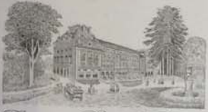
Trianon Palace Versailles