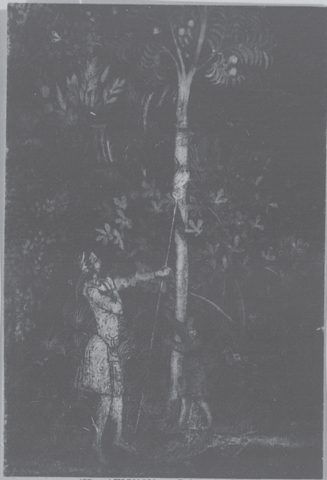
127 AVIGNON. — Palais des Papes. Fresque de la Tour de la Garde-robe. — Chasse à la Chouette. — LL