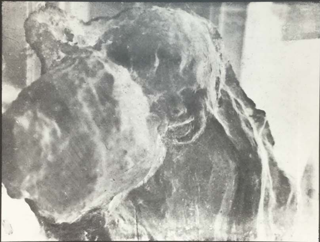
« AETAS AUREA » (1888).

(Galleria del sig. Rouart, Parigi. - Madame Du Gast, Parigi. - H. Eisler, Vienna. - Fles, Olanda - Museo della Città di Parigi).