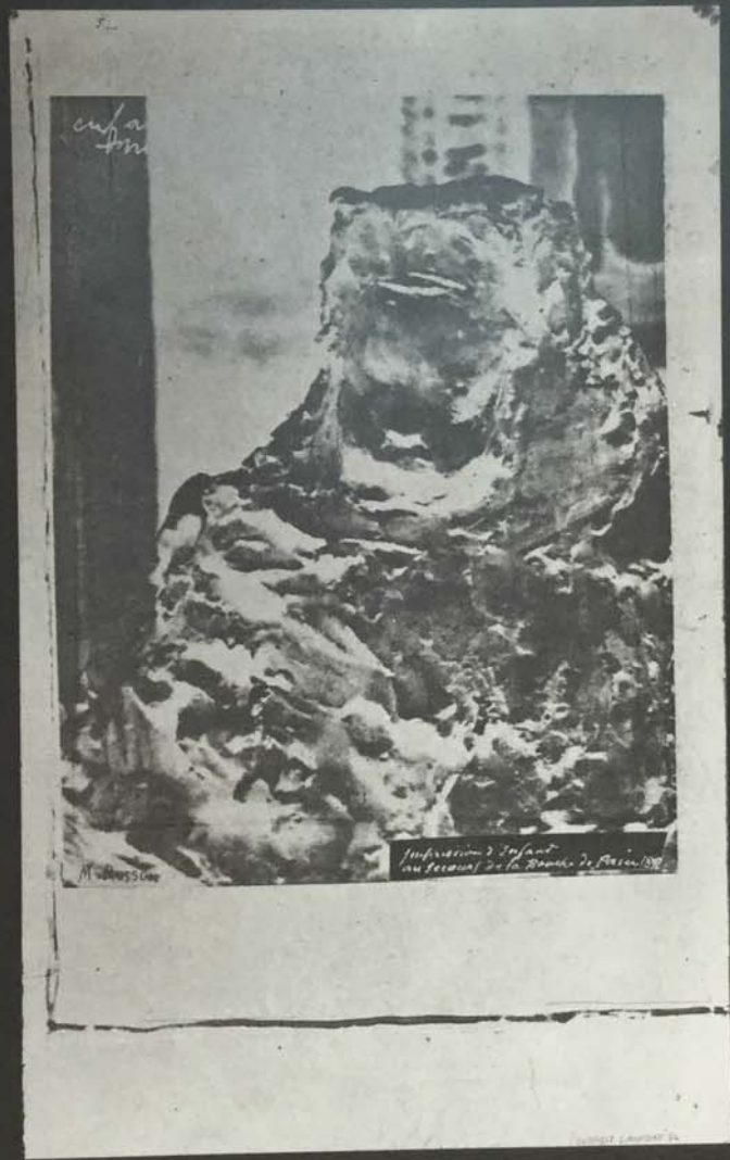
IMPRESIONE DI BAMBINO ALLE CUCINE POPOLARI. (Proprietà della signora Fles).