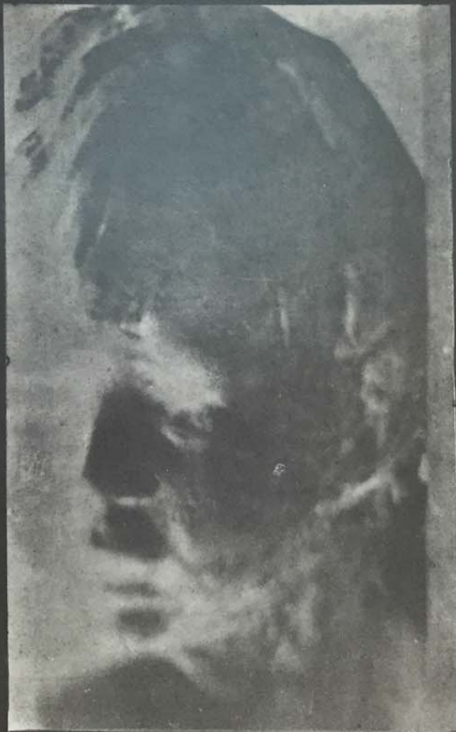
IMPRESSIONE DI BAMBINO (ANNO 1892).

(Proprietà del Museo di Hagen. - Museo di Troyes, Francia. - Coll. J. Faure. - E. Bach, Baden. Galleria Grout. - Docteur Babinski. - H. Rouart. - Docteur Noblet. - A. D'Ahrau. - G. Sforzi, Firenze).