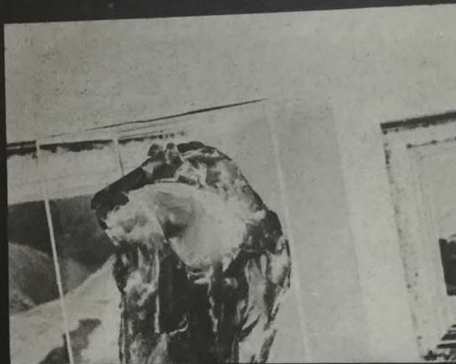
IMPRESIONE DI BOULEVARD (SIGNORA VELATA - 1888).

Acquistato dal Governo Francese ad iniziativa di G. Clemenceau.