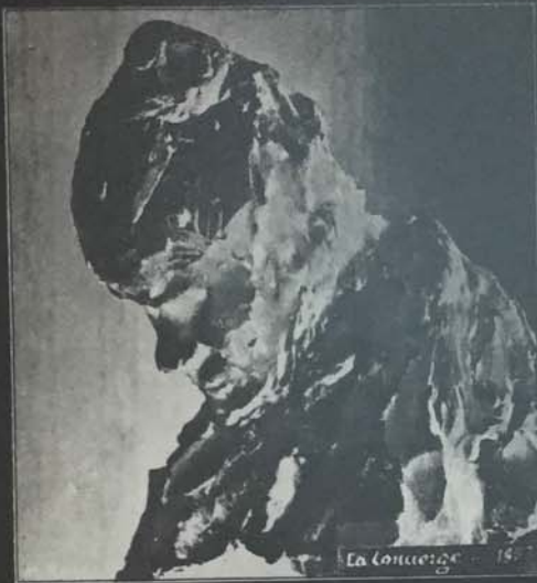
(BRONZO). IMPRESSIONE DI PORTINAIA (ANNO 1883). (Collezione Egyedi, Budapest - Fies, Hollande).

ancora dalla lotta aspra con lo stolto, palese convenzionalismo accademico, del pensiero rivoluzionario, puro e casto, però; già lavorava il poeta dell'Engandina, Giovanni Segantini, nell'eremitaggio della silenziosa valle di Brianza al suo nuovo ideale, malinteso, ignorato dai suoi compatrioti, in completa rottura con gli accademici goffi della Brera. La scultura trova poi in Constantin Meunier il più devoto, appassionato successore di Millet nella singola figura sociale del minatore, figura rozza, grossolana, a tratti semplici e primitivi: il poema del lavoratore. Scacciato con furiosa veemenza il falso, leccato, artificioso classicismo dei primi, scacciato pure l'atteggiamento allegorico-romantico, sorge con maggior forza e potenza il più tenace, il più veritiero « realismo ». Il vangelo di Francisco Goja si ascolta con stupore dalla bocca dei Manet, dei Sezanne e Degas. La nuova letteratura, realistica anch'essa, appoggia questi giovani forti ed audaci; Zola e Huysmans scrivono con sfogo entusiastico i loro concetti sull'arte, ed in tal modo essi impongono al pubblico la nuova bellezza, di cui è banditrice la vecchia Parigi: mèta dei pellegrinaggi dei giovani artisti, come ai tempi passati lo fu Roma. Max Klinger tenta rinnovare la scultura cromatica dei greci con il suo inverosimile,