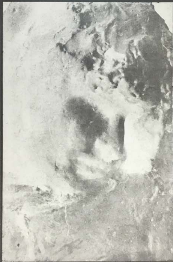
(IMPRESSIONE). CARNE ALTRUI (MILANO, 1882). Appartiene a Herman Paul - Collezione H. Rouart, Madame Gutherz (Vienna).

accanto a questo luridume, a questa putredine della vita miserabile, dove gli uomini sono gli automi e gli strumenti di un destino avverso, v'è pure un raggio di sole più ardente, più splendente: v'è la felicità più pura. Un sorriso innocente sul viso dei bimbi, desiderosi di cura materna, con lo sguardo tenero in cui si rispecchia l'anima infantile, calda e buona, essi guardano ingenuamente nel mondo, trapassante rapido dal riso alle lagrime, dal mutismo pensoso alla gaezza sfrenata; questi omini, solo un padre