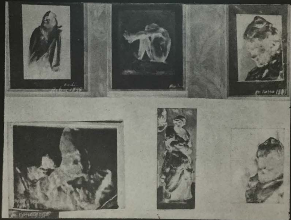
SALON D'AUTUNNE (1904).