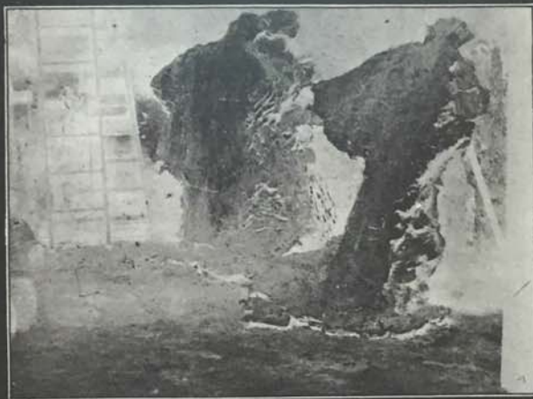
« PARIS LA NUIT ». (IMPRESSIONE DI BOULEVARD).

e la realtà può essere cangiata dai romanzi fantastici di Werther ed Ortis, può essere cangiata dagli artisti sognatori o da quelli ignoranti che si dibattono tra un'arte falsa ed una vita artificiale, da poetastri fannulloni; ma non può essere cangiata giammai da chi possiede la forza, il coraggio, un principio e la genialità di guardarla in faccia.