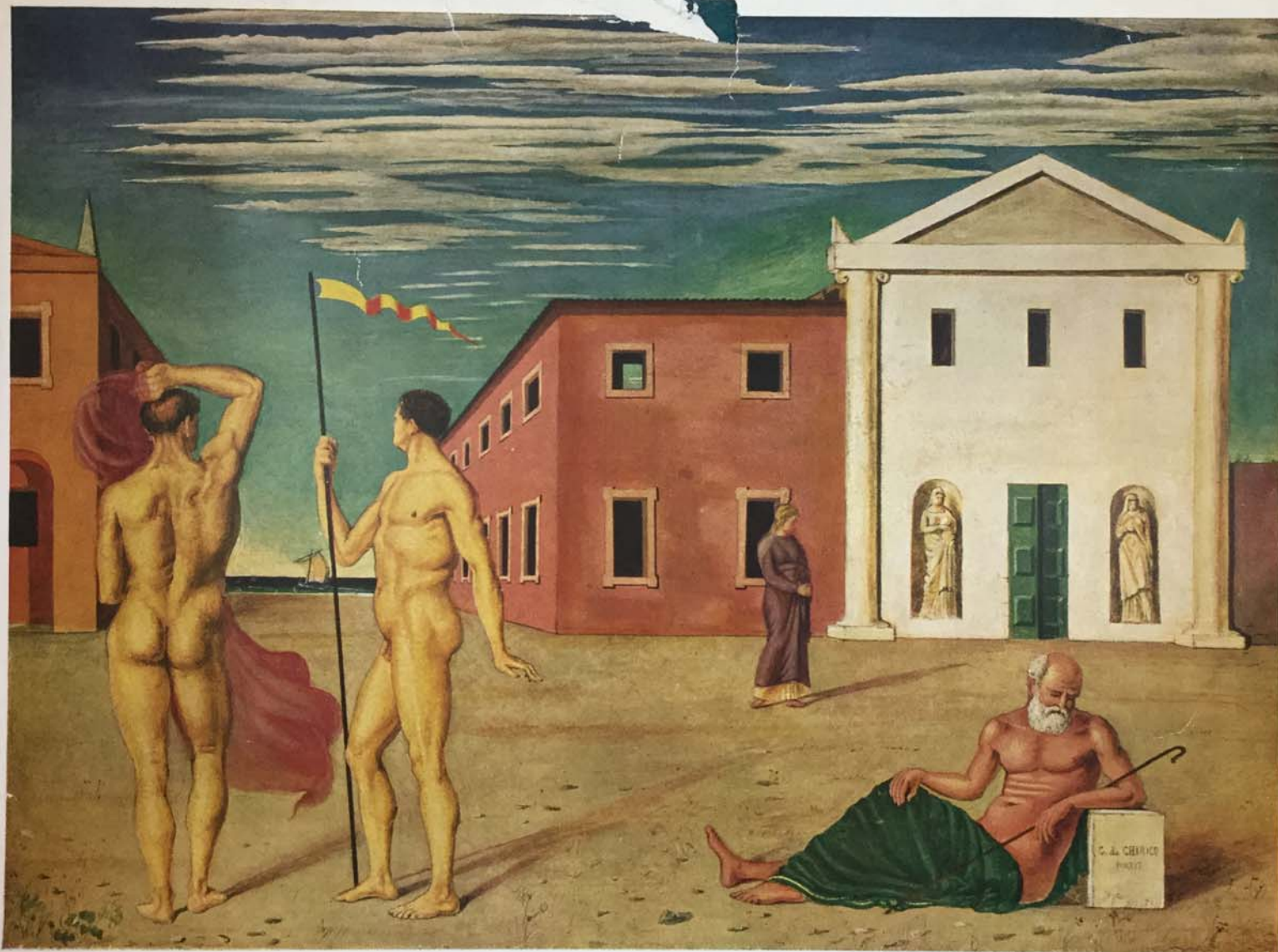
1013 - GIORGIO DE CHIRICO La partenza degli Argonauti - 1922 (tempera 73 x 54) Argonauts sail off - Argonautenabfahrt - Le départ des Argonautes

Galleria del Milione - Edizioni - Milano - Via Brera, 21 Printed in Italy - Copyright by Galleria del Milione 1940