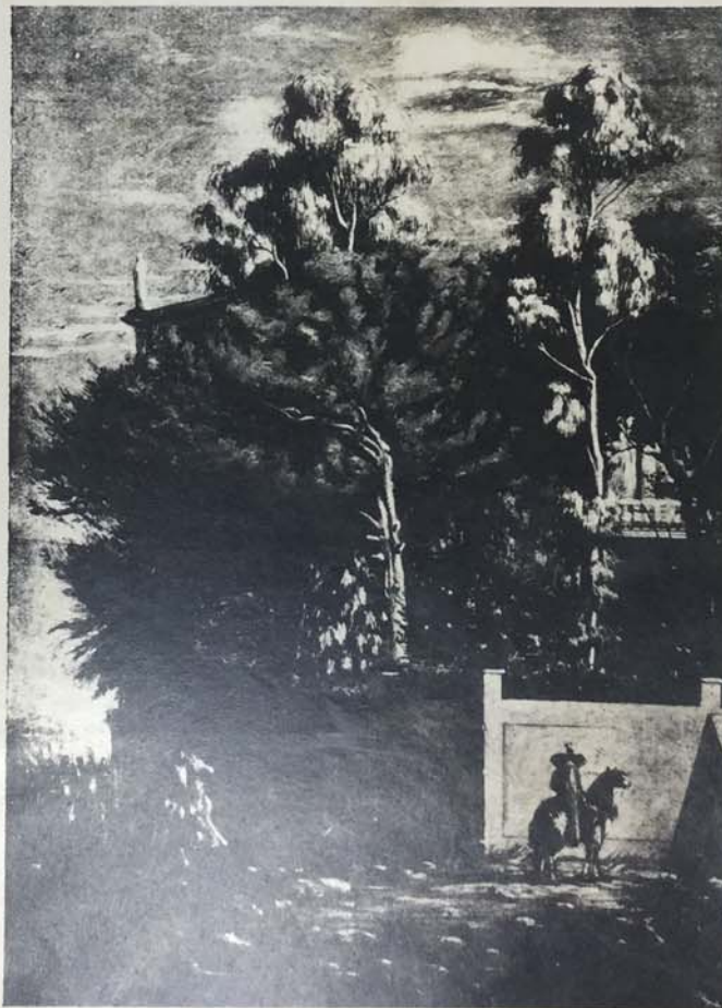
De Chirico, "Villa romana con cavalieri", 1922

UN GRUPPO DI OPERE SCELTE DI SEMEGHINI, DE PISIS, MORELLI, DE CHIRICO, CARRÀ, ROSAI, SIRONI E TOSI NELLE NOSTRE SALE DALL'8 AL 24 GENNAIO 1941