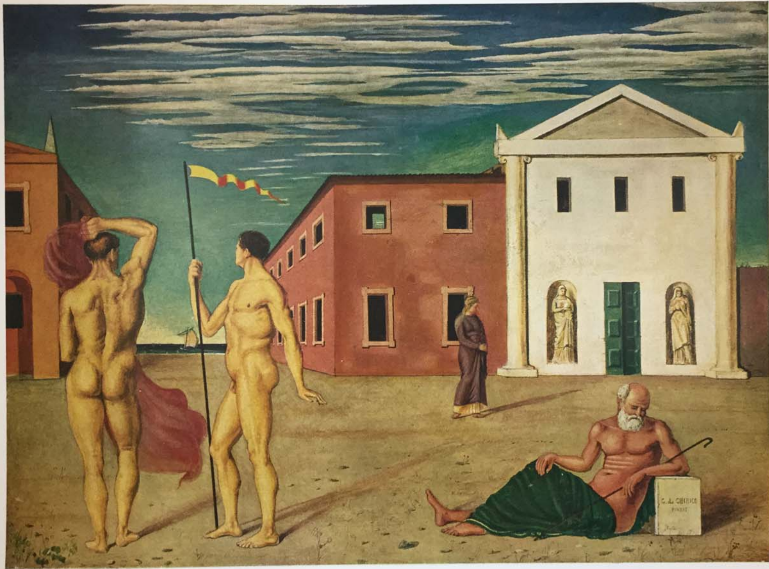
1013 - GIORGIO DE CHIRICO La partenza degli Argonauti - 1922 (tempera 73 x 54) Argonauts sail off - Argonautenabfahrt - Le départ des Argonautes