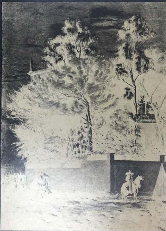
De Chirico. "Villa romana con cavalieri", 1922

UN GRUPPO DI OPERE SCELTE DI SEMEGHINI, DE PISIS, MORELLI, DE CHIRICO, CARRÀ, ROSAI, SIRONI E TOSI NELLE NOSTRE SALE DALL'8 AL 24 GENNAIO 1941