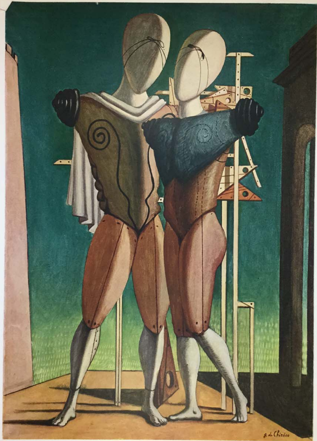
1005 - GIORGIO DE CHIRICO Ettore ed Andromaca - 1917 (olio 65 x 92) Hector and Andromache Hektor und Andromache Hector et Andromaque

Galleria del Milione Edizioni - Milano, Via Brera, 21 Copyright by Galleria del Milione 1938 - XVI