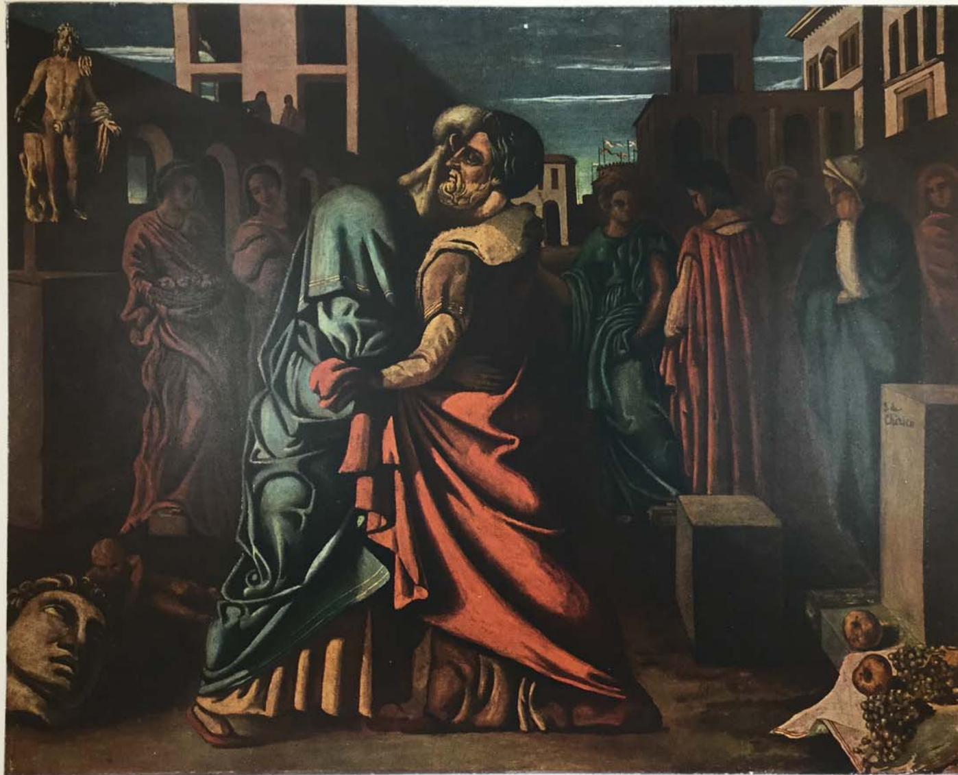
1021 - GIORGIO DE CHIRICO Il ritorno del figliol prodigo - 1919 (olio 99 x 88) Die Rückkehr des verlorene[n] Sohnes - La vuelta del hijo prodigo - The Prodigal Son's Return