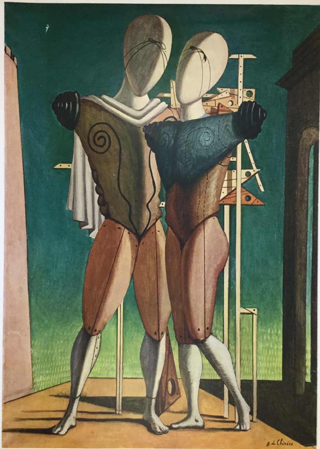
1005 - GIORGIO DE CHIRICO Ettore ed Andromaca - 1917 (olio 65 x 92) Hector and Andromache Hektor und Andromache Hector et Andromaque

Galleria del Milione Edizioni - Milano, Via Brera, 21 Copyright by Galleria del Milione 1933 - XVI