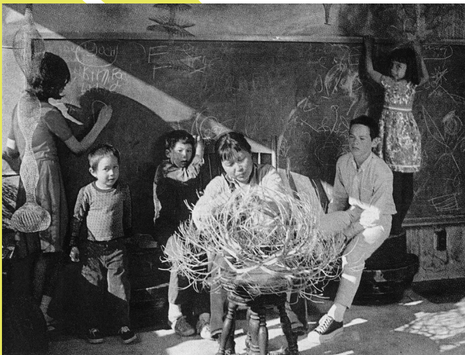
Ruth Asawa y sus hijos en la terraza acristalada de su casa en San Francisco, California, 1964.

Durante su adultez, Asawa enseñó arte en las escuelas. También era madre y creaba arte en su estudio de casa, acompañada por sus seis hijos.